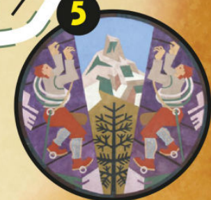
Serrada, piazza santa Cristina n. 13, "Maso Rensi", Barbara Tamburini, Montagna e scalatori (pannello di destra del trittico Sport alpestri), 2008, tavola sabbata. Tratto dall'omonima opera di Fortunato Depero, 1941, tarsia di stoffe, 193 x 165 cm, Trento, collezione ITAS Assicurazioni.