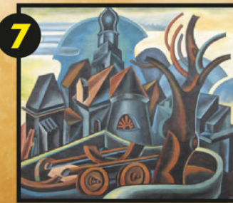
Serrada, via Filzi, Barbara Tamburini, Abside della chiesa di santa Cristina di Serrada, 2013, tavola sabbata. Tratto dall'omonima opera di Fortunato Depero, 1953, olio su tela, 80 x 80 cm, collezione privata.