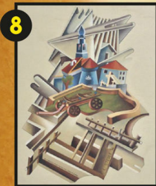
Serrada, via Filzi, già edificio scolastico, Luigi Stedile, 2006, pittura a secco. Come indica l'autore nella parte bassa dell'opera "Tratto da Serrada (prospettiva della luce)" e "Chiesa di Serrada". (opera privata)