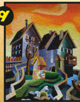
Serrada, via Antonio Rosmini n. 21, Barbara Tamburini, Paesaggio alpestre, 2010, mosaico in smalto di vetro. Tratto dall'omonima opera di Fortunato Depero, 1936, olio su tavola, 51,5 x 70 cm, collezione privata.