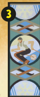
Serrada, via Schimi n. 25, Barbara Tamburini, Gli sciatori, 2009, tavola sabbata. Particolare ripreso dal trittico di Fortunato Depero Sport alpestri, 1941, tarsia di stoffe, 193 x 165 cm, Trento, collezione ITAS Assicurazioni.